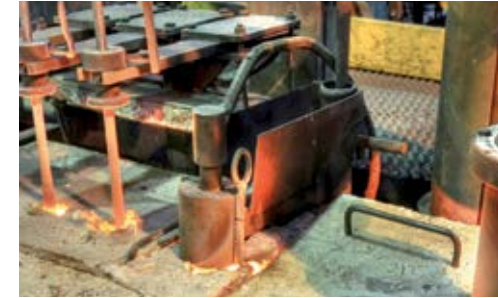
Çoğu demir dökümhanesinde, kalıplama braketleri bu pozisyonda yapılmaktadır. Probe ve koruyucu tüpü kolaylıkla değiştirilebilmektedir.