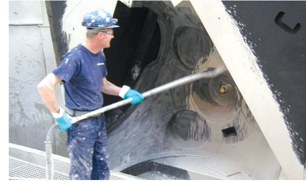
Akıtmaya boya uygulaması