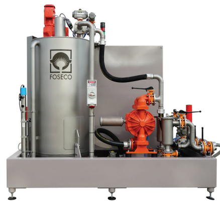
Automatizovaná Inteligentní nátěrová jednotka firmy Foseco: Sleduje hustotu nátěru v reálném čase, a proto nabízí lepší konzistenci z hlediska tloušťky mokré vrstvy.