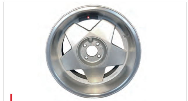
Beispiel einer Aluminiumfelge

Hervorragende Oberflächenqualität Verlängerte Lebensdauer Erhöhte Produktivität