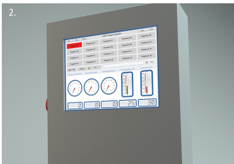
(1) Station de traitement MTS de Foseco (2) Ecran de l'opérateur du nouveau logiciel SMARTT d'optimisation du process de dégazage