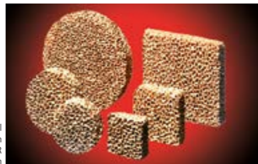
Auswahl aus dem STELEX ZR Filterprogramm

Durch STELEX ZR Filter im Gießsystem wird verhindert, dass nichtmetallische Verunreinigungen in den Formhohlraum gelangen. Zusätzliche Putzarbeiten, wie z.B. das Ausschleifen und Reparieren von Schlackeeinschlüssen, werden vermieden. Dadurch werden Fertigungszeit und -kosten pro Gussteil reduziert. Durch STELEX ZR Filter werden ebenso die Turbulenzen in der Form, und damit Fehler durch Reoxidation der Schmelze, minimiert.