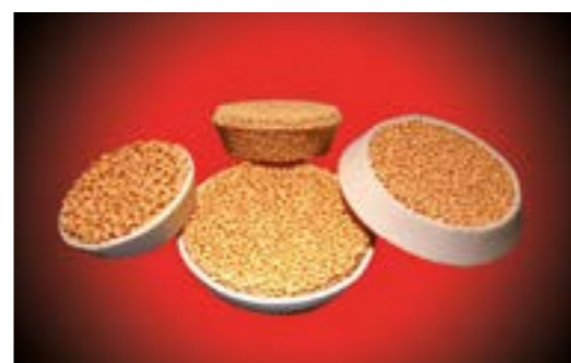
STELEX ZR Filter für den Feinguss