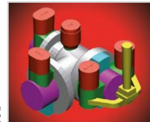
Ventilgehäuse mit Anwendung von STELEX ZR Filtern