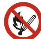
(zakaz używania otwartego ognia)