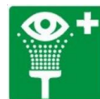
(prysznic do przemywania oczu)